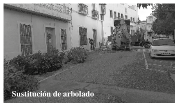
Sustitución de arbolado