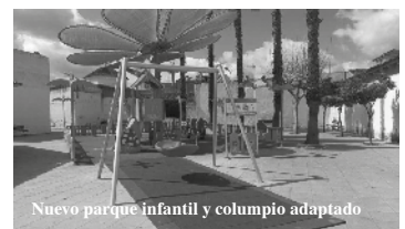
Nuevo parque infantil y columpio adaptado