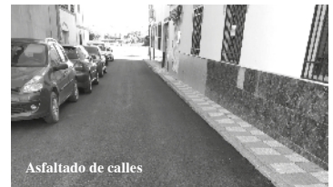
Asfaltado de calles