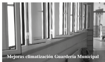
Mejoras climatización Guardería Municipal