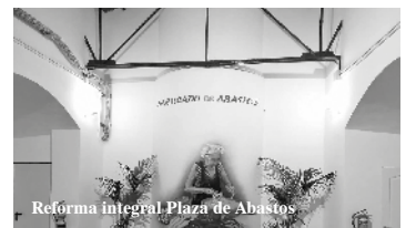
Reforma integral Plaza de Abastos