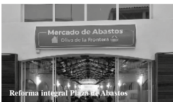
Reforma integral Plaza de Abastos