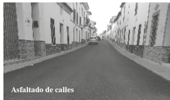
Asfaltado de calles