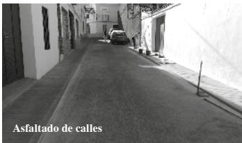
Asfaltado de calles