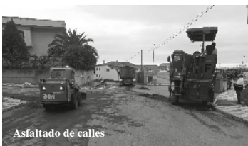
Asfaltado de calles