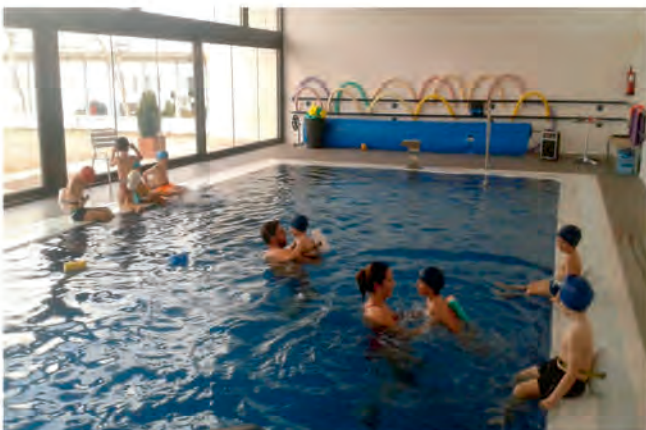
CURSOS EN LA PISCINA CLIMATIZADA

Además de la actividad deportiva diaria se han realizado con gran éxito otros eventos y citas deportivas que se seguirán repitiendo con el Raid Ruta de los Contrabandistas o el Zumba Party, donde participan más de 200 personas. También han sido un verdadero éxito los cursos ofrecidos en la piscina climatizada de Oliva de la Frontera.