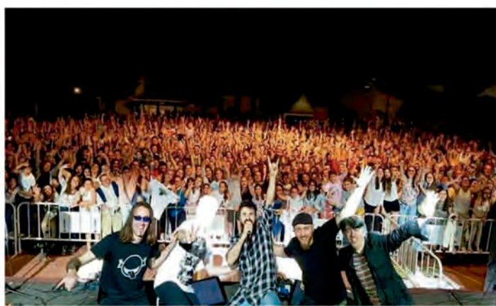
CONCIERTO DE HUECCO EN LA FERIA DE LA DEHESA