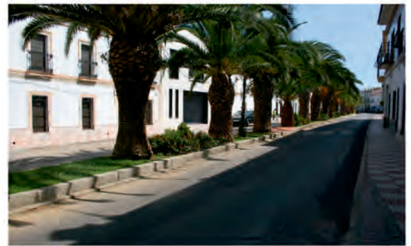
CALLE SAN PEDRO