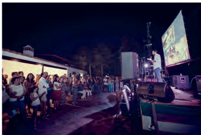
I EDICIÓN DE OLIVA WIT

Uno de los aspectos básicos que ha pretendido el Ayuntamiento es el fomento del emprendimiento, especialmente entre los más jóvenes, para que puedan encontrar en nuestra localidad oportunidades de trabajo y sobretodo que las puedan generar ellos mismos. Actividades lúdicas como el Oliva WIT tienen esta pretensión entre sus principales objetivos. Ya se ha celebrado también una edición especial durante la Feria de la Dehesa en el que las mujeres han sido las protagonistas: “Mujer y Dehesa” , un proyecto de WomenBeing, cuya edición de Oliva ha sido la primera en celebrarse en España .