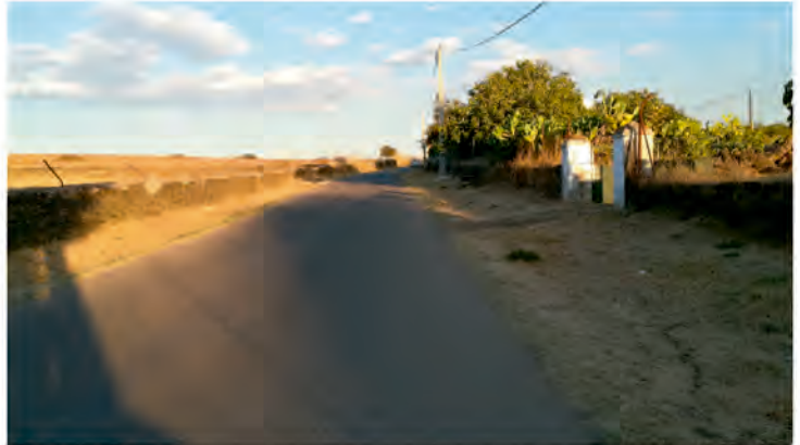
DESBROCE EN EL CAMINO DE LOS GRIFOS

-Camino de "Los Grifos", "La Potrera", camino "El Pantano", "La Pila", "El Molinillo", "Helechal" y camino "La Matilla".