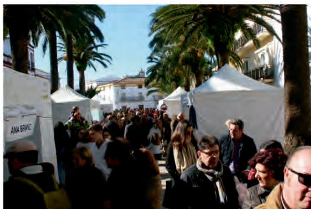
OUTLET EN EL PASEO DE LAS PALMERAS

Otra novedad que hemos puesto en marcha para fomentar el comercio local y ayudar a los comerciantes de nuestro pueblo y que ha contado con una gran acogida tanto entre los empresarios locales como entre el público asistente. El desarrollo del Outlet en el Paseo de las Palmeras viene realizándose dos veces al año: en enero y agosto.