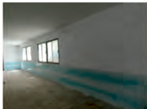
INSTALACIONES DE LA PISCINA MUNICIPAL