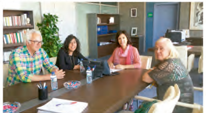
REUNIÓN CON LA CONSEJERA DE EDUCACIÓN Y EMPLEO DE LA JUNTA DE EXTREMADURA