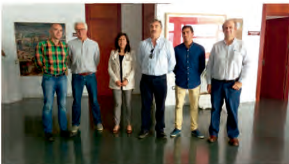
REUNIÓN CON DIRECTORES GENERALES

Con todo esto se pretende hacer llegar las circunstancias de nuestra localidad a las distintas instituciones y representantes para tratar de mejorar la vida de todos los habitantes de Oliva.