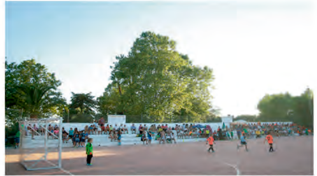
GRADAS EN LA PISTA DE LA PISCINA

-Se han construido unas nuevas gradas en la pista deportiva de la piscina municipal debido a la gran demanda que se produce durante el Maratón de Fútbol de verano y que ha recibido el nombre del memorial del campeonato: "Memorial Francisco Gamero Méndez".