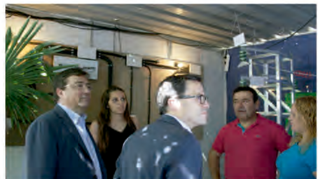
AUTORIDADES CONOCEN EL TRABAJO DE LA ESPECIALIDAD EN REDES ELÉCTRICAS