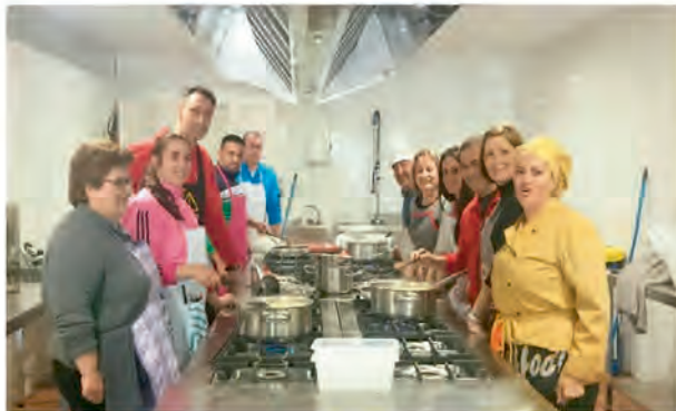
CURSOS DE COCINA MEDITERRANEA