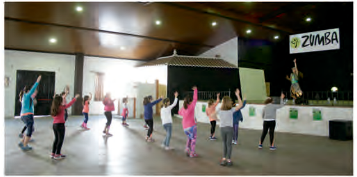
ZUMBA KIDS EN LA CASETA MUNICIPAL

La Concejalía de Deportes del Ayuntamiento de Oliva de la Frontera ha aumentado este curso la oferta de disciplinas deportivas. A las 16 que ya se venían impartiendo, se han sumado otras modalidades como ha sido Multideportes, Zumba Kids y Fútbol 8 alevín.