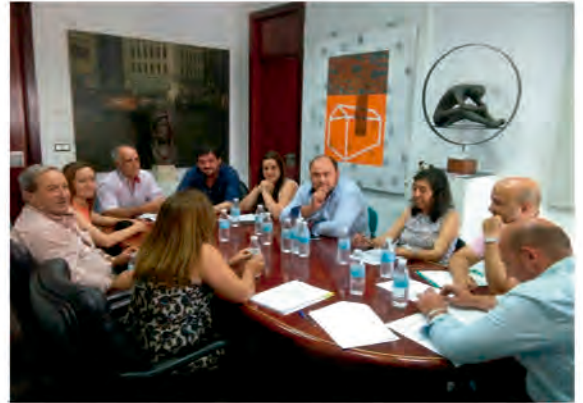
REUNIÓN ALCALDES DE LA MANCOMUNIDAD

Por no hablar de los programas de arreglo de caminos, talleres de empleo, cursos de formación y demás competencias que puedan ser asumidas.