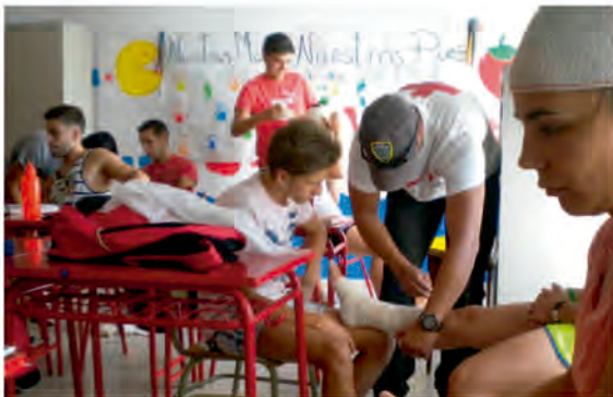
CURSOS DE SOCORRISMO ACUÁTICO

Además destacar el curso de Socorrismo Acuático y Primeros Auxilios, o el de Ocio y Tiempo Libre, cursos muy demandados entre la población joven.