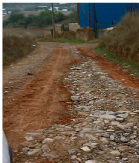
ESTADO ACTUAL DE UN CAMINO EN EL QUE AÚN NO HAN TRABAJADO LAS MÁQUINAS