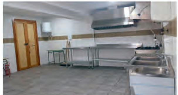
NUEVA COCINA EN LA CASETA MUNICIPAL

-Construcción de una nueva cocina en la Caseta Municipal , más amplia y mejor equipada que la antigua, ya que había problemas de espacio. Además se han repasado todos los canalones de la Caseta Municipal.