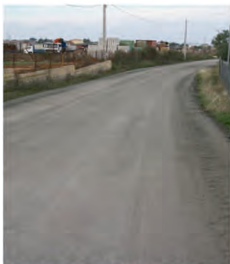
ESTADO ACTUAL DE UN CAMINO TRAS LOS TRABAJOS DE LA DIPUTACIÓN DE BADAJOZ