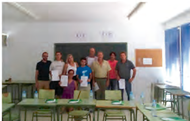
TALLER EN EL CENTRO JUVENIL

Este programa subvencionado por el Sexpe y organizado por la Asociación Plena Inclusión de Extremadura, sirve de apoyo y ayuda al colectivo de parados de larga duración con discapacidad de Oliva y pretende mejorar la calidad de vida de estas personas. La valoración por las personas destinatarias de las entrevistas individuales realizadas y de la formación impartida ha sido muy positiva, con un elevado porcentaje de participación. Estas actuaciones comenzaron el 19 de junio y se han estado desarrollando en las instalaciones del Centro Juvenil con 26 usuarios derivados del Sexpe.