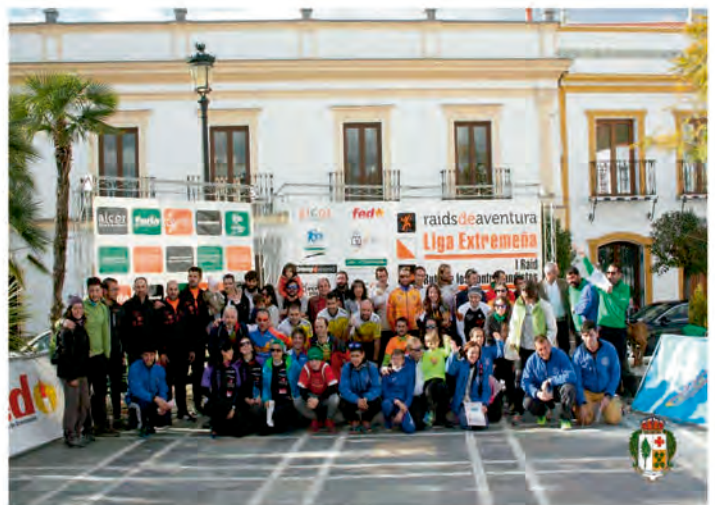
RAID RUTA DE LOS CONTRABANDISTAS