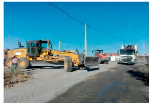
TRABAJOS DEL PARQUE DE MAQUINARIA