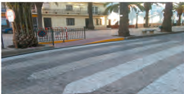
PASO DE PEATONES ELEVADO EN EL PASEO DE LAS PALMERAS

Se ha ejecutado una rampa de acceso en el C.P. Maestro Pedro Vera con el que ya se cumple con la normativa de accesibilidad.