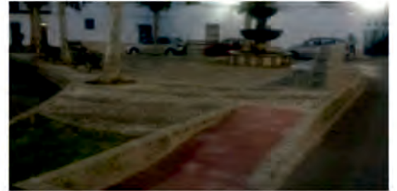
ACCESIBILIDAD EN PLAZA FUENTE NUEVA