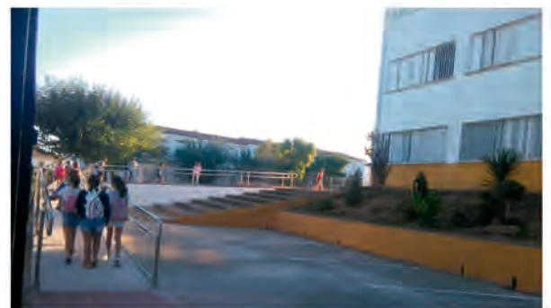
RAMPA DE ACCESO EN EL C.P. MAESTRO PEDRO VERA