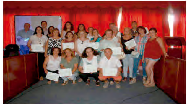
@PRENDIZEXT GERONTOLIVA III

2. Solicitada por la Mancomunidad Sierra Suroeste para los municipios de Oliva de la Frontera, Valencia del Mombuey y Zahínos, con un año de duración, para un total de 15 alumnos-trabajadores en la especialidad "Monitor/a de actividades de tiempo libre" que permiten la obtención del correspondiente certificado de profesionalidad.