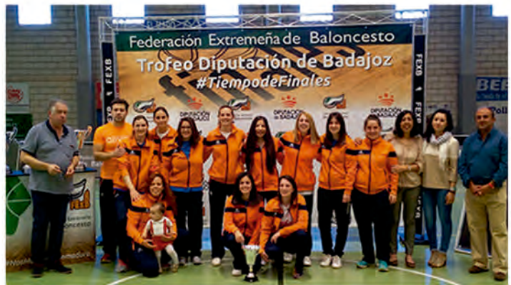
BALONCESTO TROFEO DIPUTACIÓN DE BADAJOZ

El Club ha contado con el apoyo del Ayuntamiento para la celebración del Trofeo de Diputación de Badajoz. Por primera vez, Oliva ha sido sede y anfitriona de este importante evento deportivo en el que además participaron los dos equipos locales.