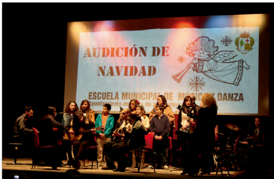
AUDICIÓN DE LA ESCUELA MUNICIPAL DE MÚSICA EN EL AUDITORIO

El objetivo es seguir por este camino y ofrecer a los alumnos una oferta cada vez más numerosa y variada, tanto en música como en danza.